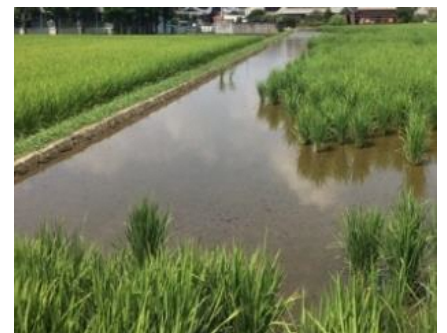
食害を受けやすい 入水口・排水口や周縁部（畦際付近）