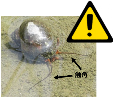
ジャンボタニシ（スクミリンゴガイ）