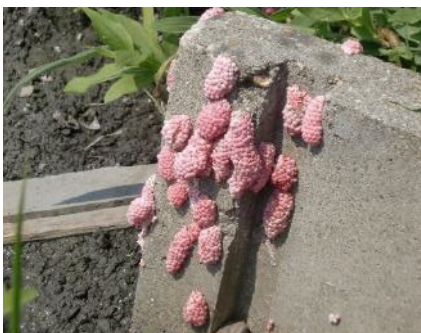
用水路（水口）の卵塊