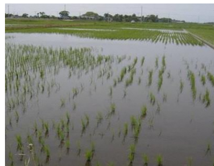
食害を受けた水田