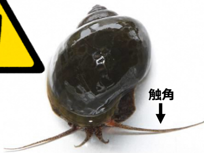
ジャンボタニシ (スクミリングガイ)