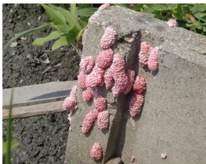
用水路（水口）の卵塊