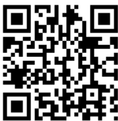
不法投棄やっつけ隊動画

昨年3月14日は京都府の「不法投棄やっつけ隊」に参加し、田原川に不法投棄された大型ごみなどを撤去しました。