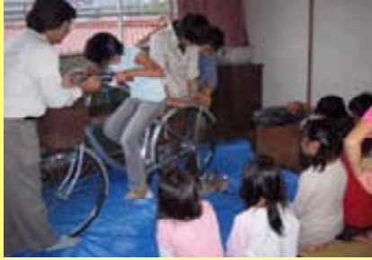
地球の学校の様子

終了後に運営委員会を開催いたします。委員会への飛び入り参加もお待ちしております。なお、第2・3回の開催日は、決まり次第会報誌等でお知らせします。