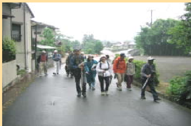
自然環境体験ハイキングのようす