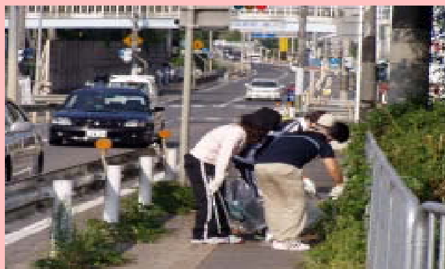
環境美化活動のようす

本会をはじめ各環境団体とのパートナーシップ（参加・協働）により、環境美化活動を行います。