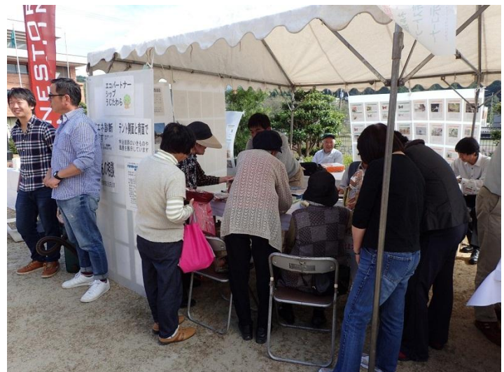
省エネ診断、いきもの相談など