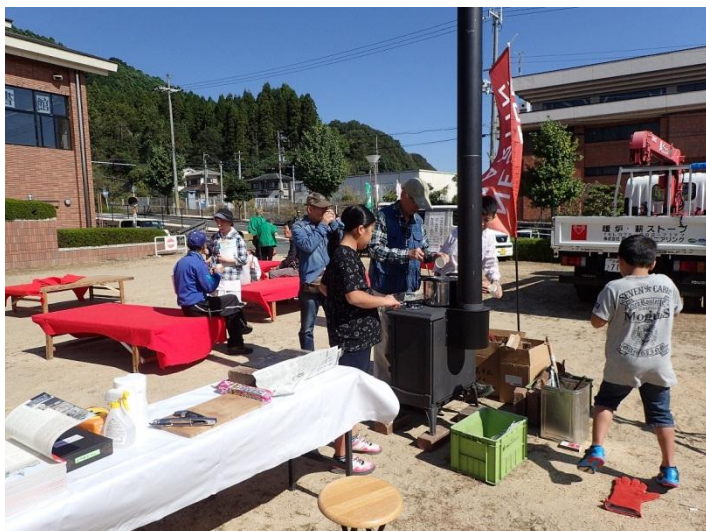
薪ストーブの実演展示

平成29年10月15日(日) 午前10時～午後3時 宇治田原町総合文化センターにて