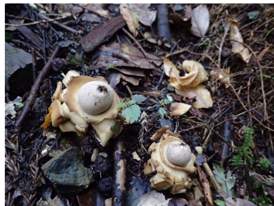
エリマキツチグリ