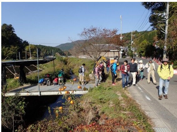
大道寺地区を歩く