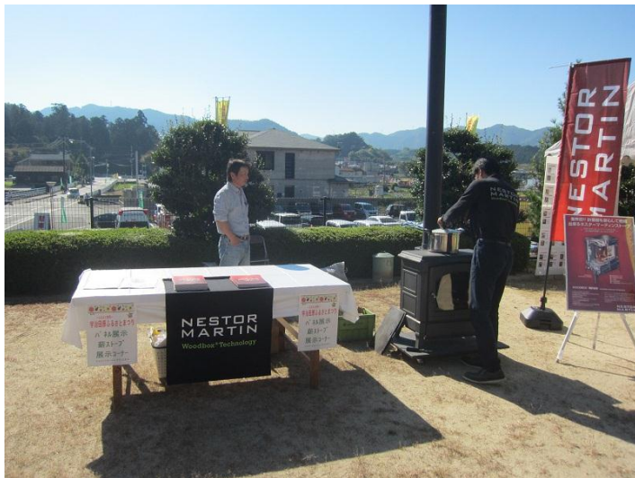
薪ストーブの実演展示

平成28年10月16日(日) 午前10時～午後3時 宇治田原町総合文化センターにて