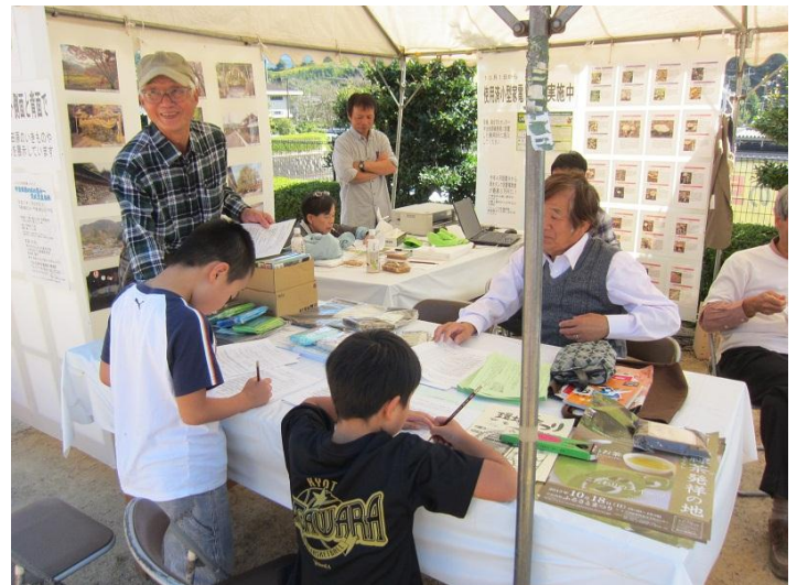
省エネ診断、いきもの相談など