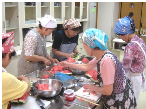
【昨年夏のエコクッキングの様子】

【日 時】平成26年7月27日（日）午前9時～午後2時 【場 所】維孝館中学校 調理室 【参加費】一人500円 【締め切り】平成26年7月25日（金） 【申込・問合わせ】エコパートナーシップうじたわら事務局 宇治田原町役場 建設・環境課 TEL 0774-88-6639 E-mail junkan@town.ujitawara.kyoto.jp