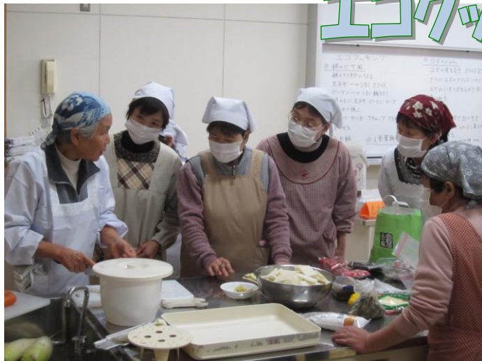
【エコクッキング教室の様子】

『エコクッキング教室の様子』などのご感想や今後取り組んでほしいテーマについてのご意見を頂きました。