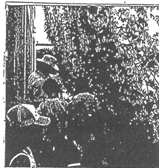
みどりのカーテンをくぐる

（シャワーの消費エネルギーはテレビ何台分？—「お！」テレビ（80W）の300台分）