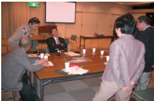
地球の学校の様子