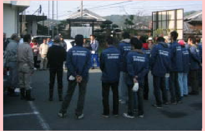
環境美化活動参加者のようす

今後も、本会をはじめ各環境団体・企業とのパートナーシップにより、環境美化活動を行います。