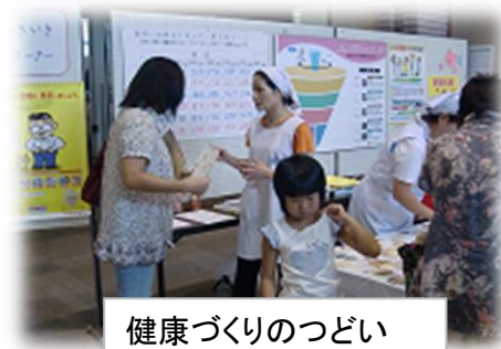
健康づくりのつどい