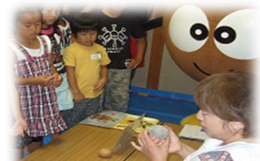
父と子のチャレンジクッキング