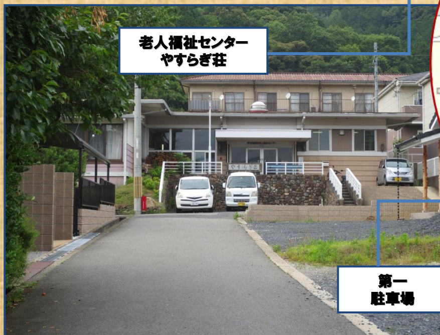
老人福祉センター やすらぎ荘