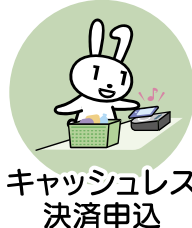
キャッシュレス 決済申込