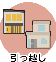
引っ越し (2023年7月頃より)