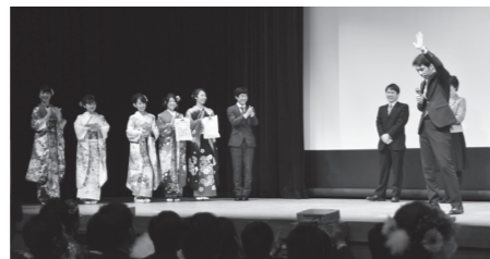
↑懐かしい恩師の登場に沸く会場

成人式を迎え、新成人になったということは、私たちが正式に大人の仲間入りを果たしたということになります。自らの発言、行動の一つひとつに責任を持って行動していきます」と言葉を述べました。