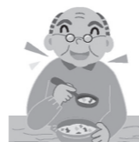
対象 町内在住で高齢者の食事に興味のある方。高齢者に食事を作っている家族 定員 先着15人

対象 町内在住・在勤者のみの10人以上の団体 ※毎年手続きが必要 受付期間 2月1日（水）～15日（水）※火曜日除く 申込方法 所定の申請書に必要事項を記入のうえ提出 備考 許可書を発行後、施設を利用できます。 【町住民体育館（☎88・4567）