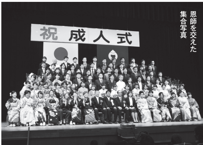
恩師を交えた集合写真

平成29年成人式が1月8日（日）総合文化センターで行われ、振り袖や羽織、真新しいスーツ姿で出席し