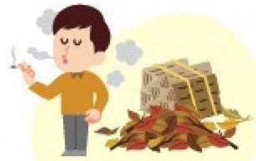
可燃物の近くの喫煙