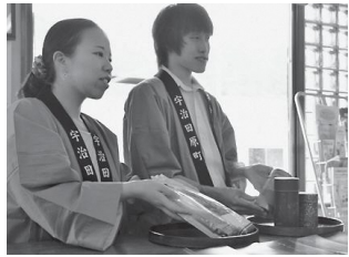
町のお土産として、目玉商品となるような商品アイデアをお持ちの方、ぜひご参加ください。

町では、新たな観光資源の掘り起こしや既存の観光資源を活用した商品開発等に向け、さまざまな分野の団体や個人の知恵をお借りする検討会の開催を計画しています。 この検討会議に参加していただける団体や個人を広く募集します。検討会議では固定観念にとらわれず、自由な発想でいろいろなご意見をお聞きしたいと考えています。 あたたかみのあるアイデアがある方やご興味のある方のご参加をお待ちしています。 対象 ▼町内の農工商、