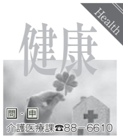
Health 健康 介護医療課 ☎88-6610

病気の早期発見のために人間ドックを受けましょう 国民健康保険や75歳以上の後期高齢者医療保険加入者を対象に人間ドックの費用助成を行います。