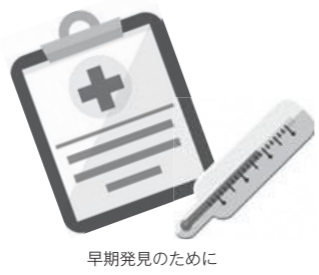
早期発見のために

病気の早期発見のために人間ドックを受けましょう 国民健康保険や75歳以上の後期高齢者医療保険加入者を対象に人間ドックの費用助成を行います。