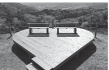
あなたのユニークなアイデアでまちを「ハート」でブランディングしてください。

で解雇しない ③新規雇用者を町内の事業場で1年間以上従事させる(移住促進枠については3年間以上居住・従事) ④町税を課税され完納している 申込期限 雇用開始月から3カ月以内 詳細は町HPまで 図・圏 産業観光課 ☎88-6638