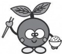
全国2位の給食を食べるっチャ

高齢者学び応援バスポート 高齢者の生きがいづくり・健康増進のため、「高齢者学び応援バスポート」を発行しています。