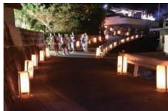
やんたん灯りまつりの様子

これからみなさんと様々な形でお会いすることがあると思います。住みやすい町づくりのお手伝いができるように努めていきたいと思っておりますのでどうぞよろしくお祈いします。