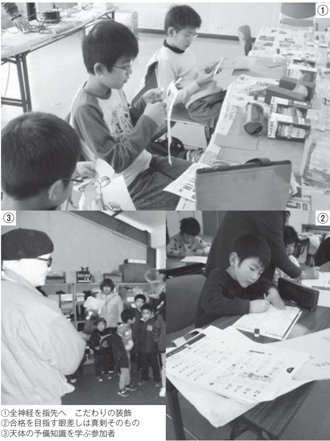
①全神経を指先へ こだわりの装飾 ②合格を目指す眼差しは真剣そのもの ③天体の予備知識を学ぶ参加者

今回の「冬のまなび」は、「冬の星空観察会」と「子ども工作教室」を行いました。観察会の参加者は、オゾン大星雲やシリウス星団などレンズの向こう側に広がる神秘的な星々の世界に引き込まれ、とても感動