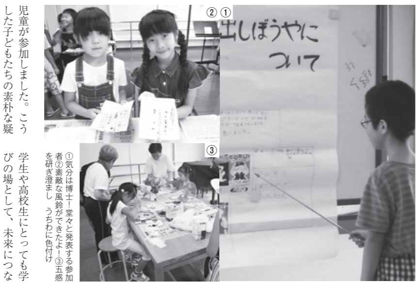
①気分は博士！堂々と発表する参加者の素直な風鈴ができたよ！②五感を研ぎ澄まし、うちわに色付け ③夏休みの思い出を語り、子どもたちが地域の方々と一緒に学び、大

開講2年目を迎えた今年の学び塾には、10講座にのべ364人の子どもたちが参加しました。大学生、高校生を含む地域の方々も共有した学びの時間は、夏休みの貴重な経験として記憶に残ることでしよう。事業の成果は生涯学習フェスティバル文化祭などで展示する予定です。今回の学び塾では、学年別にALT（外国語指導助手）と楽しく学ぼうと、英語、煎茶道や絵手紙の教室、漢字検定の対策講座など昨年からの講座に加え、初開講となった子ども工作教室（リサイクルガラスの風鈴絵付け）に多くの子どもたちが参加し、意欲的に学びました。