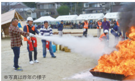
※写真は昨年の様子