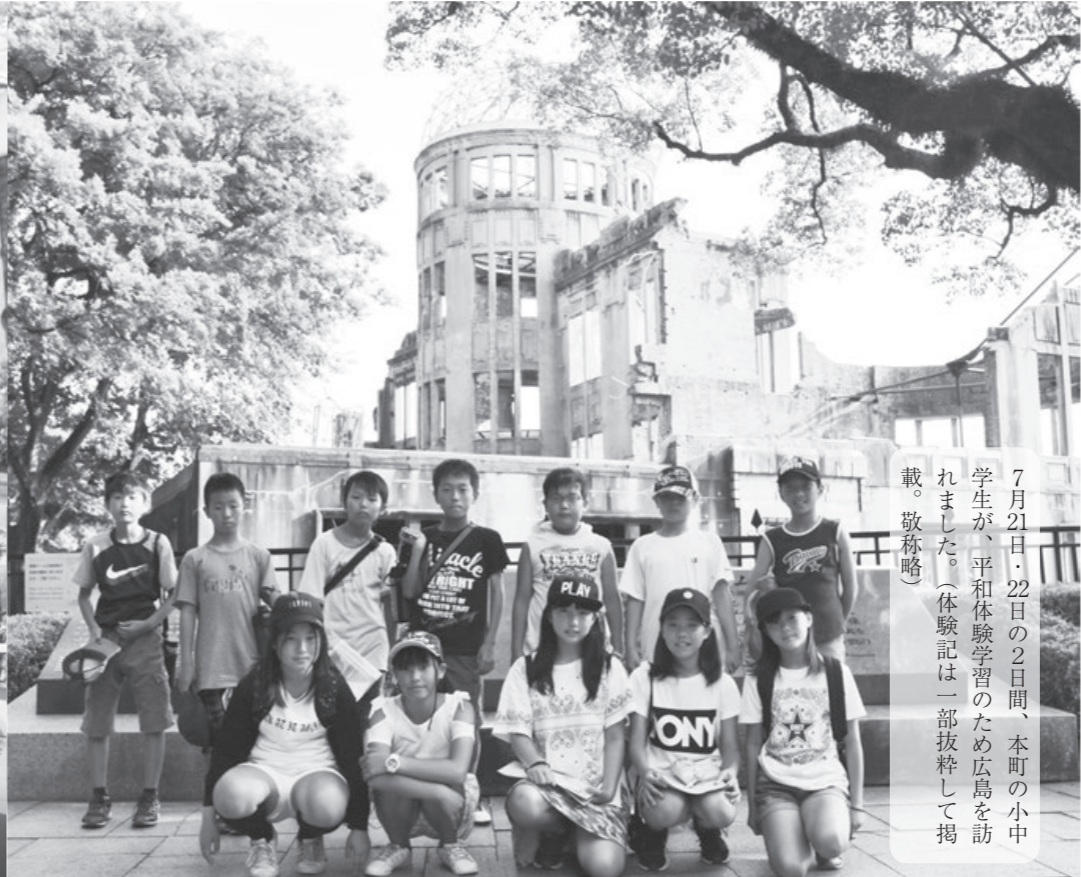
7月21日・22日の2日間、本町の小学生が、平和体験学習のため広島を訪れました。(体験記は一部抜粋して掲載。敬称略)