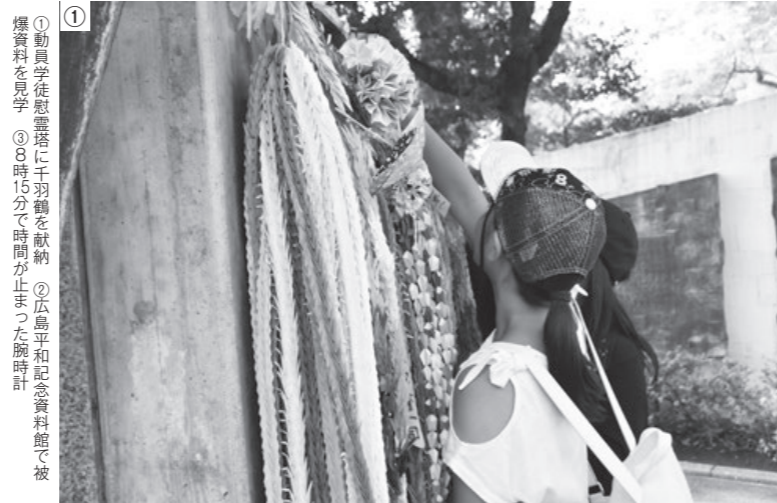
① 動員生徒慰霊塔に千羽鶴を献納 ② 広島平和記念資料館で被爆資料を見学 ③ 8時15分まで時間が止まった腕時計

また、本町のマスコット茶ッピーをはじめ4市町のマスコットによるゆるキャラショーや模擬店も開催され、会場は親子連れの参加者で賑わいました。