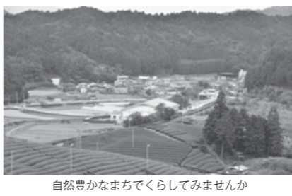
自然豊かなまちでくらしませんか

基本的な指針「第5次まちづくり総合計画」や「まち・ひと・しごと創生総合戦略」で目標にする地域創生と将来人口に向け進めます。