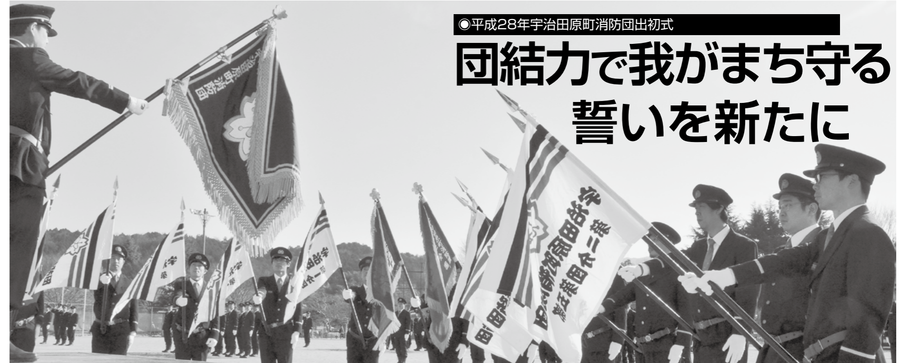
●平成28年宇治田原町消防団出初式