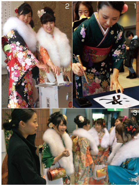
1) 好きな一文字を選んで筆をふる。2) 「今年一番活躍しそうなはたちの有名人」への模擬投票を体験。結果は①橋本愛33票②平岡卓14票③桐生祥秀7票④入山杏奈5票。3) 旧友や恩師との再会を喜び、記念撮影する姿が多く見られた。4) カメラマンの「好きなポーズとってください」のあと。