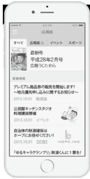
図 総務課 ☎88-6631