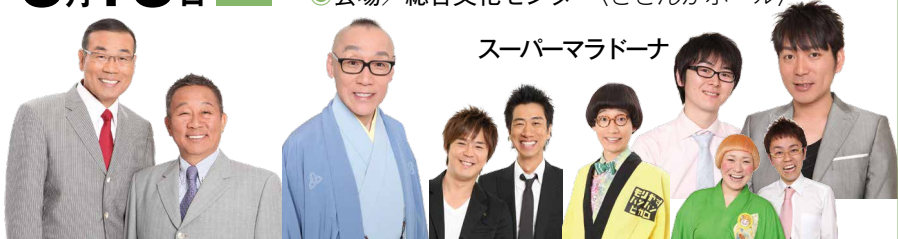
オール阪神・巨人 桂小枝 テンダラー もりやす 女と男 スーパーマラドーナ パンパンピガロ

3月13日(日) 開演/午後2時(開場/午後1時30分) ◎会場/総合文化センター(さざんかホール)