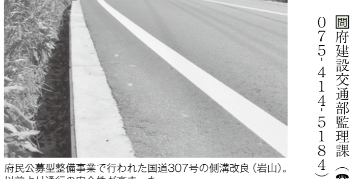
府民公募型整備事業で行われた国道307号の側溝改良（岩山）。以前より通行の安全性が高まった。