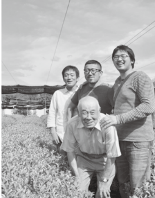
【←今号の表紙】座談会のあとの4人。秋空の下、賢田船戸にある勝谷さんの茶園で。 【↓4枚の個人写真】4人それぞれの受賞茶園で。