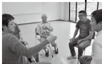
9月14日、総合文化センターに集まってもらった。和やかなやりとりの中に、茶づくりにかける熱い思いがにじみ出ていた。