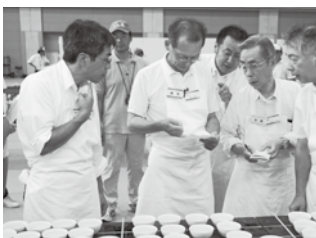
【関西茶品評会】茶品評会の産地賞は、同一自治体の上位3人（1人200点満点）の合計得点で競われる。今年の関西茶品評会「かぶせ茶の部」では、宇治田原の出品者が2、4、11位に入り産地賞を獲得。5、6、8位に入った次点の綾部市とは、たった2ポイント差であった。なお、今年の全国茶品評会の結果は5ページに掲載。