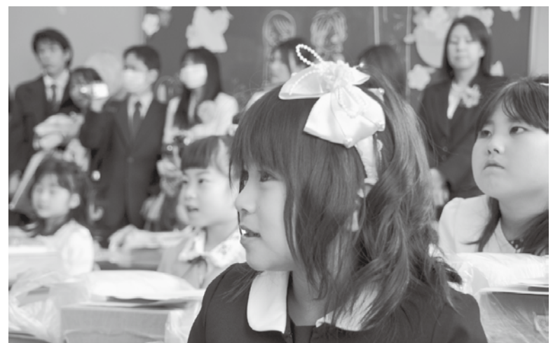
上) 目を輝かせて先生の話聞く宇治田原小の新1年生 左) 上級生に手を引かれ初めての登校

この春、233人の子どもたちが、新生活に心躍らせ、町内の小・中学校、保育所・幼稚園に入学しました。