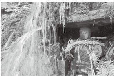
↑大滝(湯屋谷)。町指定文化財。鷲峰山系より清流があふれだす。大滝不動尊の使者は「うなぎ」とされ、うなぎにお酒を飲ませて滝つぼに放てば、たちまち雲を呼び、雨を降らすという言い伝えがある。

↑禅定寺の木造十一面観音立像。国重要文化財。平崇上人が正暦2年(991)から5年かけて創建した禅定寺の本尊。量感のある体躯表現に平安時代初期様式の名残が伺えるが、表情は和風化し、衣文の彫りもおだやかで、禅定寺が創建された10世紀末頃の作と思われる。