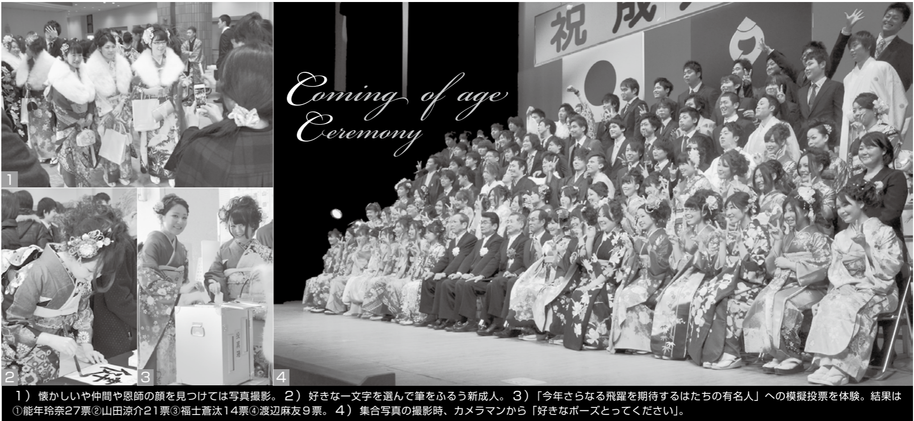
1) 懐かしいや仲間や恩師の顔を見つけては写真撮影。2) 好きな一文字を選んで筆をふるう新成人。3) 「今年さらなる飛躍を期待するはたちの有名人」への模擬投票を体験。結果は①能年玲奈27票②山田涼介21票③福士蒼汰14票④渡辺麻友9票。4) 集合写真の撮影時、カメラマンから「好きなポーズをとってください」。