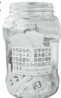
↑使用済み切手の回収箱は、やすらぎ荘、住民体育館、小中学校、商工センター、役場、郵便局などに設置。多量の場合は直接、社協までお願いします。

10キロ単位で送られる使用済み切手を初めて送ったのは平成12年。それから13年間をかけて今回、区切りの10回目を送りました。切手の整理は、切手の縁から5ミリ残してハサミで切っていく、根気がいる作業。2時間で100キロしかできません。しかし「メンバー同士楽しくおしゃべりしながら作業していると、あつという間に時間が経つ」と会のメンバーは口を揃えます。