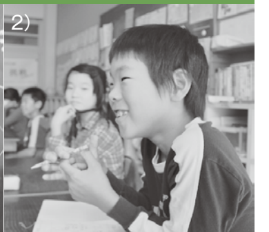
1) 中国の多様な文化を説明する陳漢峯さん。2) 陳さんの話に目を輝かす子どもたち。3) 大使の自己紹介に興味深く聞き入る。4) 大使と机を並べて給食。5) 外国で人気という日本のアニメキャラの話で盛り上がる。6) 短い時間でも特使と仲良くなっていました。