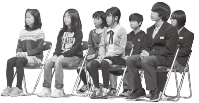
*発表内容は、要約して掲載しています。

11月15日に総合文化センターで開かれた「小・中学生主張大会」。多くの来場者を前に8人の代表者が壇上で、堂々と自分の考えを発表しました。その内容を紹介し、宇治田原町の子どもたちの思いに触れてみたいと思います。