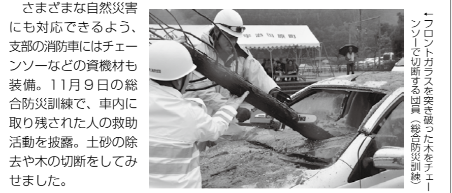
「フロントガラスを突き破った木をチェーンソーで切断する回員」総合防災訓練

消防団の活動は、消火はもちろん、その内容は多岐にわたります。地域における消防防災のリーダーとして、平常時・非常時を問わず、地元に着し、住民の安心と安全を守るという重要な役割を担っています。