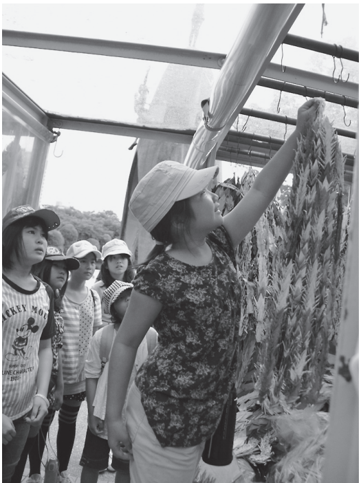
原爆の子の像に平和の祈りを込めた千羽鶴を献納

7月23・24日の広島平和体験学習には、小学生14名が参加。被爆体験記や原爆詩の朗読、平和記念資料館等での学習を通じて命や平和の尊さを学びました。また、平和への祈りが込められた千羽鶴を原爆の子の像に献納しました。 (体験記は一部抜粋して記載しています。)