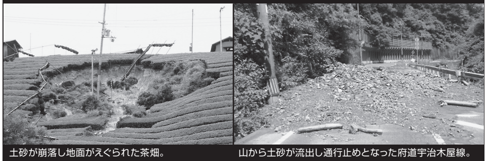
土砂が崩落し地面がえぐられた茶畑。