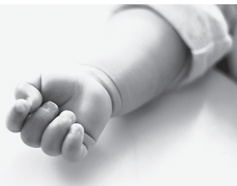
不活化ワクチンを接種する場合、初回接種として生後3～12か月に接種することが望ましいとされています。

11・25日(火) 午前10時～正午、午後1時～4時 相談方法 役場2階第2会議室へ来庁または電話(☎88・6616(当日用)・☎88・6638) ☉ 産業振興課 (☎88・6638)