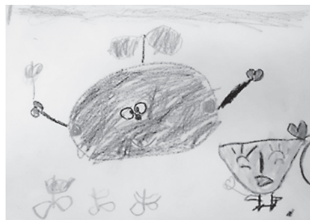
なごみ号の車内に展示される作品の一つ

③ 満70歳以上の独居高齢者 1万円 ※いづれも入院や施設入所をしている方は除きます。 支給時期 9月 図・圃 福祉課(☎88-6635) 福祉バスなごみ号「ギヤラリバス」運行 幼児が描いた茶ツピーの絵画展示