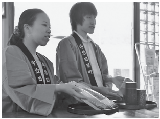
町のお土産として、目玉商品となるような商品アイデアをお持ちの方、ぜひご参加ください。

町では、新たな観光資源の掘り起こしや既存の観光資源を活用した商品開発等に向け、さまざまな分野の団体や個人の知恵をお借りする検討会の開催を計画しています。 この検討会議に参加していただける団体や個人を広く募集します。検討会議では固定観念にとらわれず、自由な発想でいろいろなご意見をお聞きしたいと考えています。 あたたかみのあるアイデアがある方やご興味のある方のご参加をお待ちしています。 対象 ▼町内の農工商、