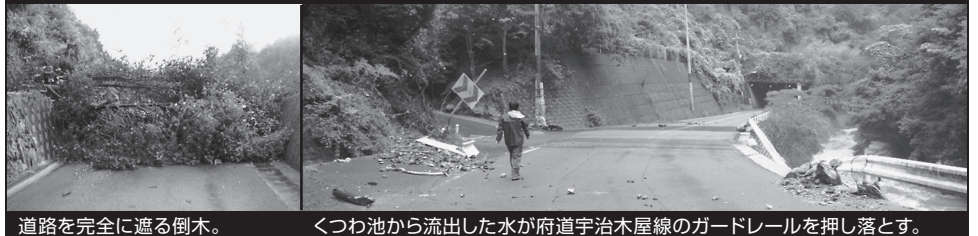
道路を完全に遮る倒木。