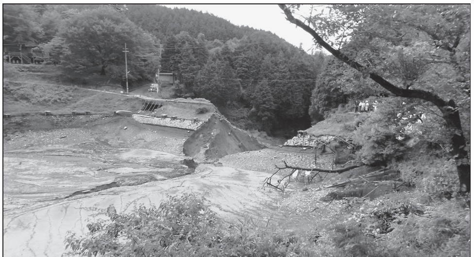
堰堤が決壊し水が流出したくつわ池自然公園のため池。

応じて、避難勧告・指示を発令することとしています。この避難情報にも注意し、発令されれば、それに従い避難してください。 大雨や台風の際、また直後に、河川や田畑には、絶対に近寄らないでください。