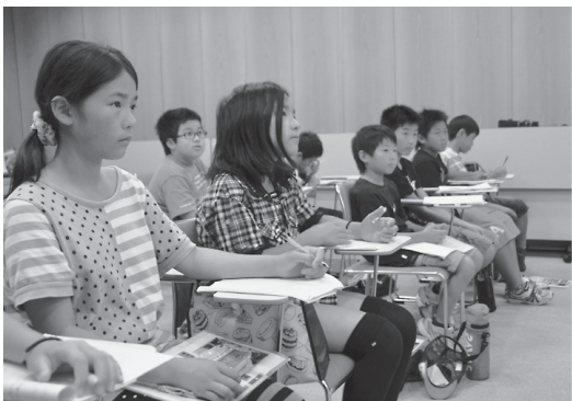
参加者と同世代で被爆した人が書いた体験記や詩を朗読