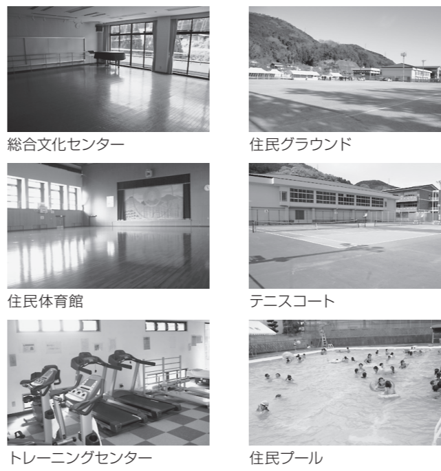
総合文化センター、住民グラウンド、住民体育館、テニスコート、トレーニングセンター、住民プール