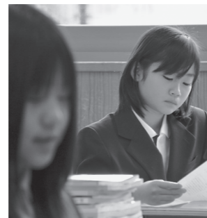
中学新1年生が環境の変化に戸惑う「中一ギャップ」。小中連携・一貫教育は中学校へスムーズに進学できることも目的にしています

町では今年度、子どもたちの豊かな心とたくましく生きる力、学力の向上を図るため、学識経験者等による「小中連携・一貫教育のあり方検討会議」を立ち上げ、その取組について審議します。本町では、ほとんどの児童が維新館中学校に進学することから、義務教育9年間を見通した「小中連携・一貫教育」を進めていきます。小・中学校の教諭が合同授業や学校の交流などを行っています。各学校の学力についての課題を共通のものとして認識し、総合的に対策を講ずること、子どもたちの学習意欲と学力の向上を図っています。検討会議では、この小中連携・一貫教育を軸として、まちぐるみの取組について審議してまいります。