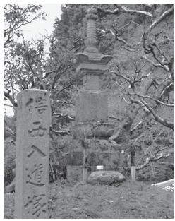
立川大道寺の信西塚

信西は、そのとき宇治田原に逃げて身を隠しますが追手に見つけられ首を斬られます。(自害説もあります)