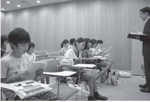
参加者と同世代の被爆者が書いた体験詩を朗読