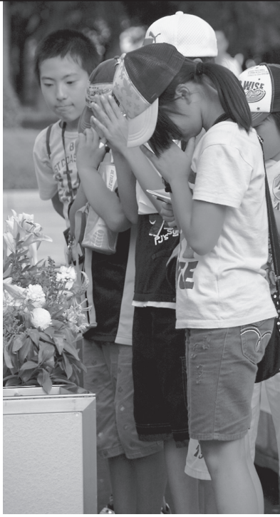
原爆死没者慰霊碑に平和への祈りを捧げる

私には父や母、弟、祖母がいて、本当に幸せなんだな、と思います。現在の日本は、平和が当たり前で、戦争や原爆のことが忘れ去られようとしています。しかし、外国では核実験や核兵器の開発がされています。核兵器のない世界を目指すためには、多くの命に戦争のおそろしさや人の命の尊さを知ってもらうことが大切です。戦争のない明るい未来を私達がつくっていくべきだと思います。