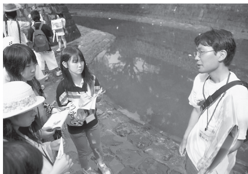
爆心地付近の下の川。被爆当時は水を飲み、息絶えた人であふれた。川には死体から出る油が浮いていた

広島市では亡くなった14万人の中には、すぐに亡くなった人もいらっしやいましたが、放射線による後遺症で白血病やガンなどで亡くなる人も多かったことが分かりました。でも、外国では、まだまだ多くの原爆をそなえています。私たちは、戦争の悲しさを未来へ受け継ぐことが大切だと思います。戦争の悲しさを知り、平和な未来をつくらせていくことの大切さを知りました。