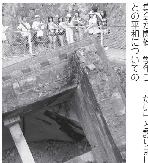
爆風で落下した浦上天主堂の鐘楼ドーム。爆心地より北東500mに位置する。重量は約50t。原爆の威力のすさまじさを示している