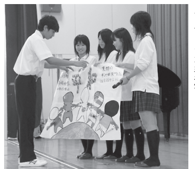
祈念集会で桜馬場中学生徒代表へ平和メッセージを手渡し

学習発表などが行われます。特使4名は交流するにあたり、夏休みを利用して数回の事前学習を重ね、世界平和を願い千羽鶴で表現したメッセージを作成。当日このメッセージを桜馬場中学校の代表に手渡し、これからの友好を確認しました。今回の体験を通して特使は「事前学習で学んだことと、実際に長崎に来て、見て、聞いたことは大きく違った。あんなにひどいとは思わなかった。あのような惨禍を二度と繰り返してはいけな」と胸に刻んできた。学校で生徒会新聞を作るなどして、学んだことを、これから広く伝えていきたい」と語りました。