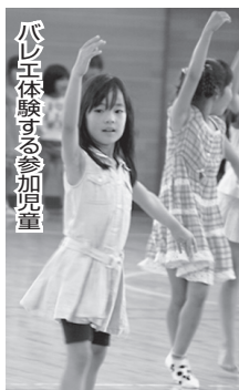
爪し体験する参加児童

本の読み聞かせ、スポーツ・文化の体験活動や昔遊びなど、私達と一緒に教室のお手伝いをしていただける方を募集しています。「月に一度だけなら」「そばで見ているだけなら」という方も大歓迎です。