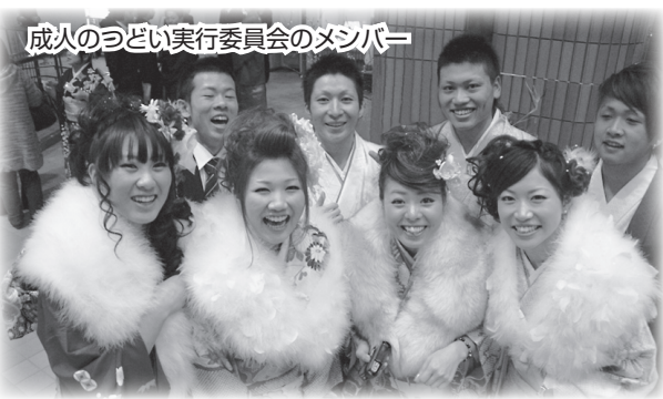
成人のつどい実行委員会のメンバー