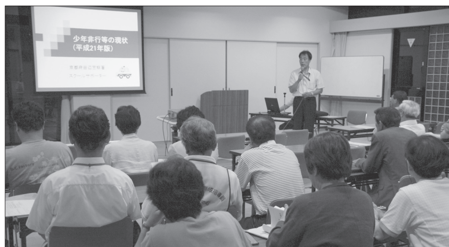
▲青少年対策協議会との合同研修会