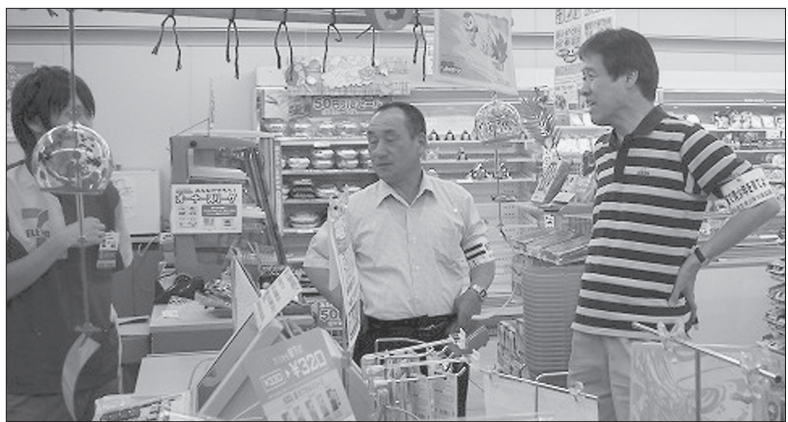
▲町内安全パトロール(各店舗での現状調査を行う委員)