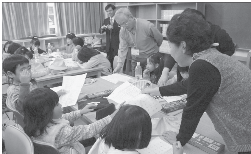
図 教育委員会教育課(☎88-5850)