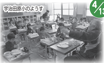
宇治田原小のようす