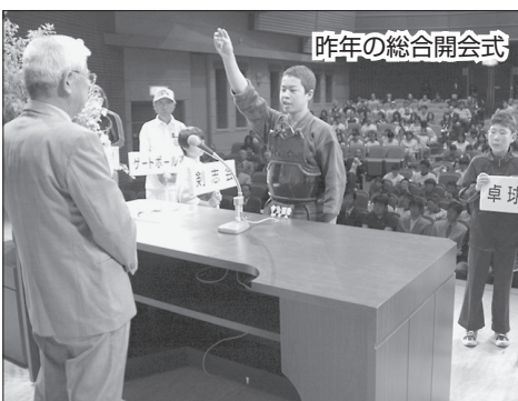
昨年の総合開会式