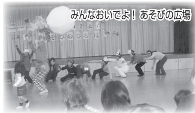
みんなおいでよ! あそびの広場

5月12日(水)～18日(火)の1週間は活動強化週間です。町内の民生委員・児童委員は、この期間中、担当地域においてPRに努めます。