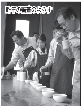
昨年の審査のようす

第35回町茶品評会を6月9日(水)の午前9時から、京都やましろ農業協同組合宇治田原支店を審査会場に開催します。