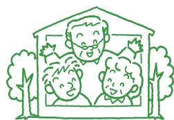
図 産業振興課 (☎88-6636)