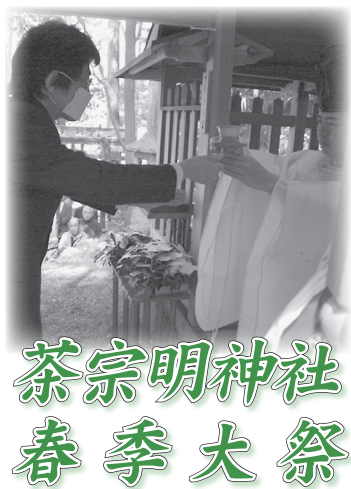
茶宗明神社 春季大祭