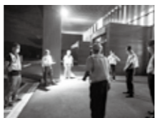
青少年対策協議会事務局（社会教育課） ☎88-6613

さつ・声かけ7か条」等を掲載しているチラシを配布しています。 ▼小・中学生主張大会 子どもたちが自分の言葉で思い思いのテーマについて発表します。毎年11月にことぶき大学とともにこの大会は、子どもたちの日頃聞けない思いや考えにふれることができますと多くの方にお願いいただいています。