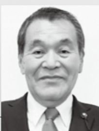
宇治田原町議会議長 谷口 整

常に緊張感をもって切磋琢磨し、チェック機能としての議会の権能をさらに高め、二元代表制の一翼を担う責務を果たし、住民の皆様への負託に応えてまいります。