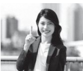
山城教育局管内の学校で働きませんか

京都府山城教育局では、11月24日(火)〜27日(金)に講師登録会を行います。来年度小・中学校で講師を希望する方は、電話で事前申し込みのうえ、指定の講師登録票または会計年度任用職員申込書を山城教育局まで提出してください。登録票・申込書は山城教育局または町教育委員会に備付けのほか、局HPからもダウンロード可。期間後も、講師等登録は