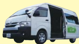
☎まちづくり推進課 ☎ 88-6616