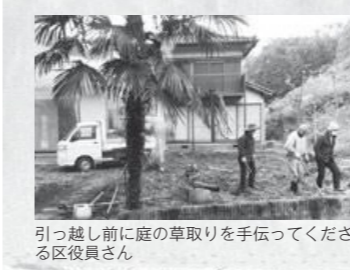
引越す前に庭の草取りを手伝ってくださる区役員さん

知県に生まれ育ち、京都に住んで15年、宇治田原に住んで12年、ここ湯屋谷では、3度目の夏を迎えました。4年と少し前に、ご縁があつて「やんたん未来プラン」に関わることになりました。湯屋谷がどこにあるかも分かっていないような状態ではありましたが、希望に胸膨らませてお邪魔したのを覚えています。