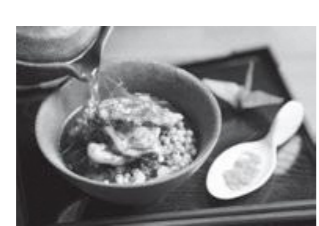
宇治茶・山城グルメを堪能

日時 3月20日（金・祝） 午前10時～午後3時 場所 城陽五里五里の丘（京都府立木津川運動公園） その他 入場無料、雨天決行・荒天中止。 ※ご来場の際は、公共交通機関でお越しください。