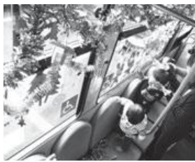
昨年のクリスマス号

町営バス クリスマス号を運行 12月25日（水）のクリスマス当日には、小学生以下のお子さんにプレゼントを用意しています。ぜひご利用ください。 運行日 12月2日（月）～25日（水） ※運行ルート・時刻は通常どおりです。町HPや時刻表でご確認ください。 プレゼント お菓子の詰め合わせ 車両 テッピー号となごみ号