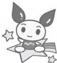
献血推進キャラクター「けんけつちゃん」