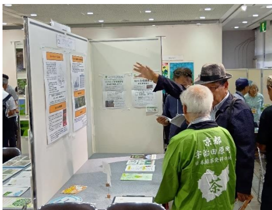
イベント ブース出展

エコパートナーシップうじたわらでは、一緒に活動する会員を募集しています。気軽に、自分のできる範囲で参加するのが特徴です。関心のある方は役員や会員、事務局までお気軽にお申し出ください。