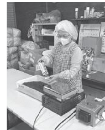
危機的状況の茶業界

答 (産業観光課長) 実態把握から支援策の提案まで、商工会と連携することで最も効果的に対応できる。国・府へ要望するとともに、「お茶のまち」として、できる限りの対応をしていく。