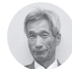
みつしまよしまさ 光島善正議員

町内在住の竹職人さんが技術の伝承(後継者づくり)、地場産業の確立と町内での材料(真竹)の調達を目指しワークショップを始められた。将来の地場産品開発に繋がり、観光資源にもなり得るものである。これらのワークショップなどの取り組みへの支援は。