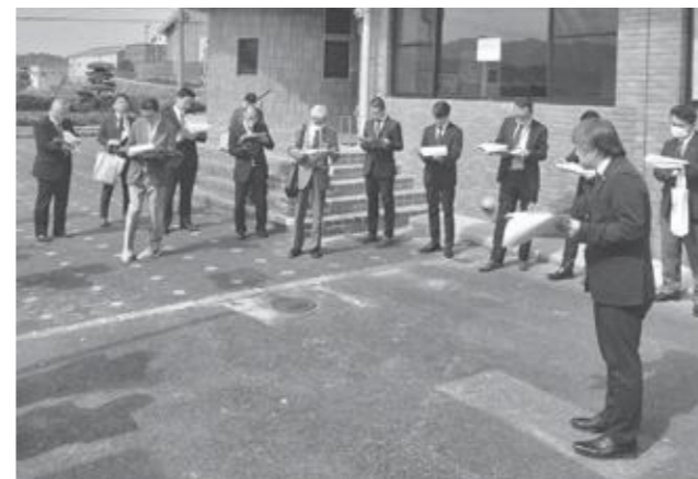
現地審査（住民体育館）

答 総合文化センター改修事業は1年半程度、体育施設集約化事業は9か月程度の工期を見込んでおり、施設にお知らせを掲示するほか、町広報紙、HPを活用して周知を図る。財源については、緊急防災・減災事業債や交付税措置のある有利な起債を活用する。