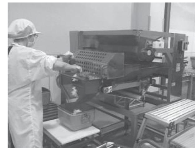
最後の直営での給食調理