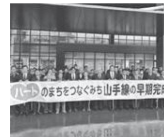
山手線住民啓発会議の様子