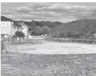
更地のままの旧役場庁舎跡地