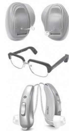
購入費補助が待たれる補聴器