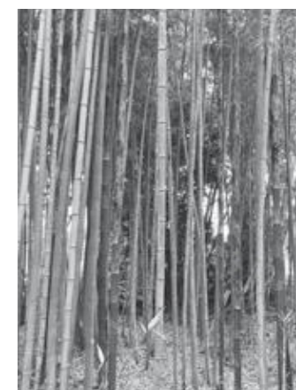
整備した真竹の竹やぶ

放置され荒れた竹林の整備などの課題は多くあるが、個人所有の竹林整備は個人の適正管理の範疇になるが、行政として課題感は共有しており、出来得る範囲でしっかりと対応する。確保した竹を使い観光資源に繋げることは意義ある取り組みであり、ワークショップの取り組みをはじめ、地域や関係人口を巻き込んだ事業等を検討する。