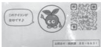
町公式 LINE 二次元コード