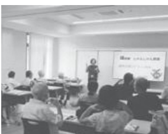
集団健康教室「輝齢者しゃんしゃん教室」

答 (企画財政課長) 土地活用目的や売却予定価格に変更もなく、意思疎通を図りながら、引き続き事務手続きを進めていく。