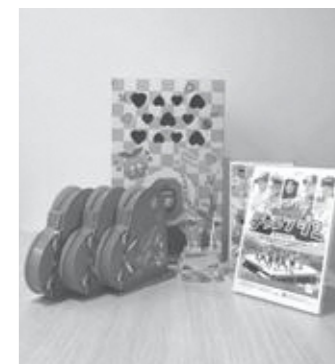
「未来挑戦隊チャレンジャー」事業とその他の取り組み

答 (町長) 夢を応援するミラチャレ事業は、学びと経験を通じ、自己実現を後押ししたいと展開してきた。「この町に育つてよかった」と感じてもらえるよう、切れ目なく続ける必要があると考える。