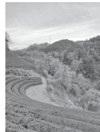
管理された里山を次の世代へ

答 (教育長) 今後は、野生動物の生態や出没の背景を学ぶ視点を加えたい。安全教育と環境教育を両立させ、子どもたちが野生動物との適切な距離感を理解し、本町の地域価値を再発見し、シビックプライドを育める学習活動を進めたい。