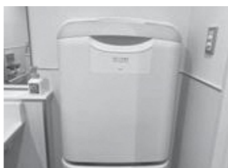
多目的トイレに設置のおむつ交換台

答 (総務理事) 防災情報などの緊急情報をはじめ、観光・イベント情報、町政に関する様々な行政情報を町公式 LINE にて配信している。今後、役場庁舎や文化センターなどの目につきやすい場所に二次元コードを掲示するなど、登録者数の更なる増加をめざし、取り組んでいく。