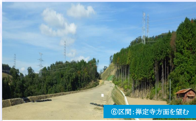
⑥区間：禪定寺方面を望む