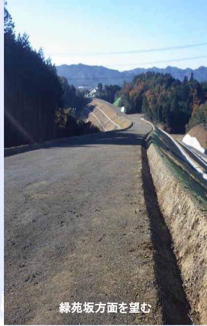
緑苑坂方面を望む

今後、新名神高速道路の工事用道路としても使用され、新名神高速道路の全線開通に合わせて令和5年度に完成する予定です。