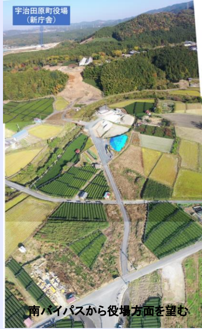
宇治田原町役場 (新庁舎)

南バイパスから役場庁舎周辺までの約1.4kmの区間は、京都府と宇治田原町が連携して整備を進めています。昨年度は南バイパスから犬打川に至る仮設道路工事が完了し、今年度は、犬打川橋梁、町道1の8号線跨道橋、役場庁舎南側の道路築造工事など本格的な工事に着手しています。