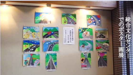
総合文化センターでのポスター画展