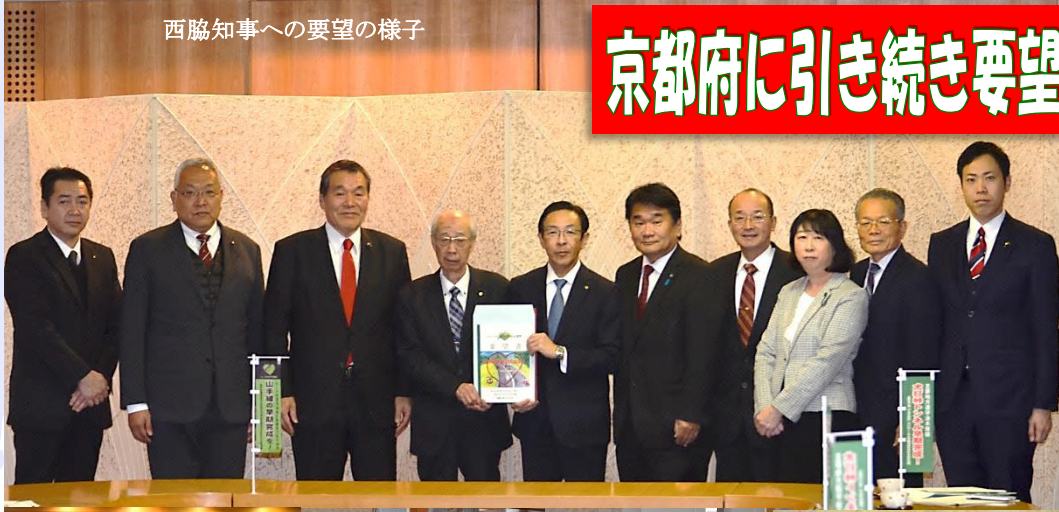
西脇知事への要望の様子