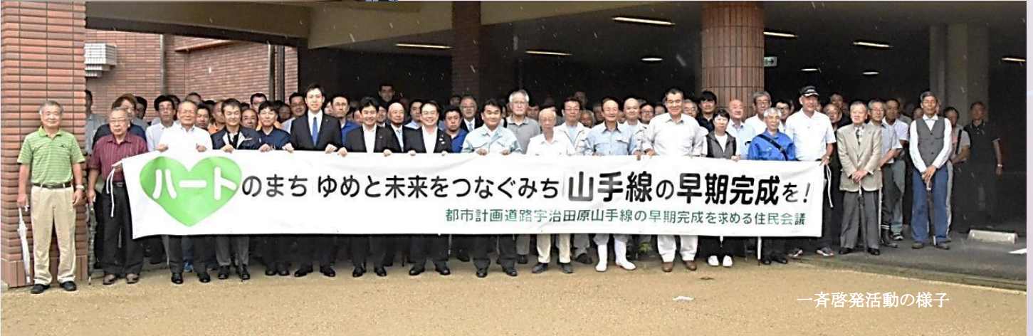
一斉啓発活動の様子