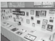
(写真は昨年度の様子)

展示期間: 7月中旬~8月下旬 開館時間: 平日: 午前10時~午後6時 土日祝: 午前10時~午後5時