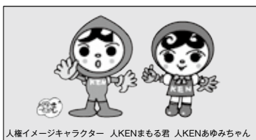
人権イメージキャラクター 人KENまもる君 人KENあゆみちゃん