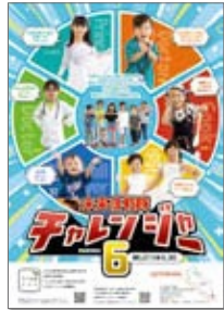
↑ミラチャレのポスターやフォトフレームを掲出していただける方も募集中です。

本町では、ふるさと納税を全額、子どもたちのために活用しています。その中でも、子どもたちの夢を応援する特色ある取組「未来挑戦隊チャレンジャー育成PROJECT」(通称:ミラチャレ)を展開しています。今年度も約20の取組を予定。次号に取組をご紹介します。