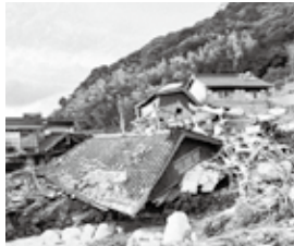
地震による被害家屋