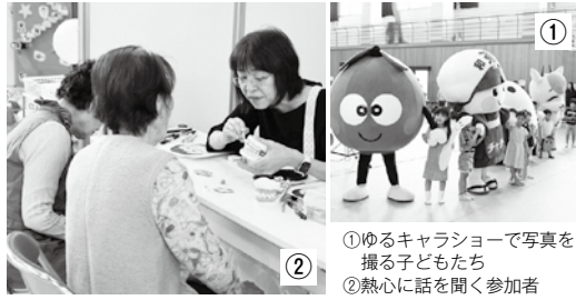
①ゆるキャラショーで写真を撮る子どもたち ②熱心に話を聞く参加者

一人ひとりの健康づくりを応援する「健活フェスタ2026」が今年も住民体育館で開催しました。