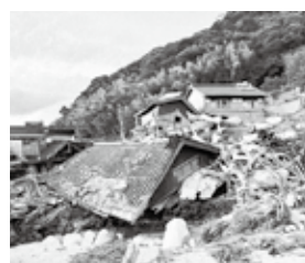
地震による被害家屋

耐震診断士の派遣 対象 次のすべてに該当する木造住宅 ①日本建築防災協会発行リーフレット「誰でもでき