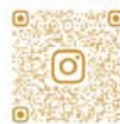
産業観光課 公式 Instagram