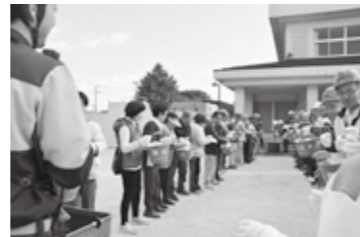
バケツリレー訓練