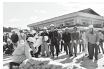
土のう作成・積土のう工法訓練