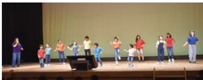
図総合文化センター ☎88-5851