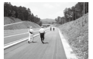
新しく開通した山手線をウォーキング(前回の取り組み)