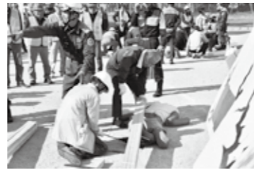
倒壊家屋救出訓練